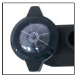
Tapa de prefiltro transparente con cierre twist-lock