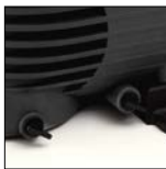
Doble purga, apertura fácil sin herramientas