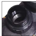
Conectores de unión suministrado (50 o 63 mm)