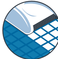
Cepillado a fondo