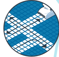
Excelente cobertura de la piscina