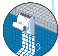
Limpieza de la línea de flotación