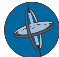
Navegación giroscópica sistema incluido