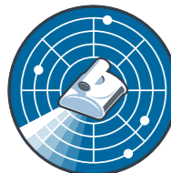
Sistema de escaneo CleverClean