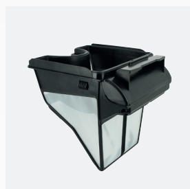
Doble Filtro Filtro: 100 µ