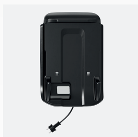
Estación de carga y almacenamiento