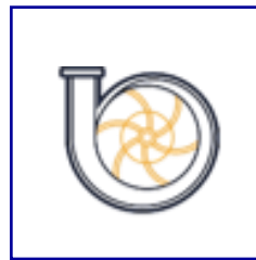
Sistema hidráulico de voluta