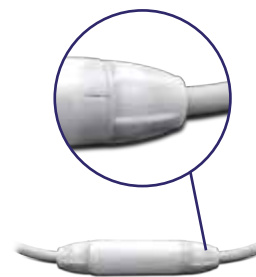
Swivel mecánico. Sistema para evitar la torsión del cable.