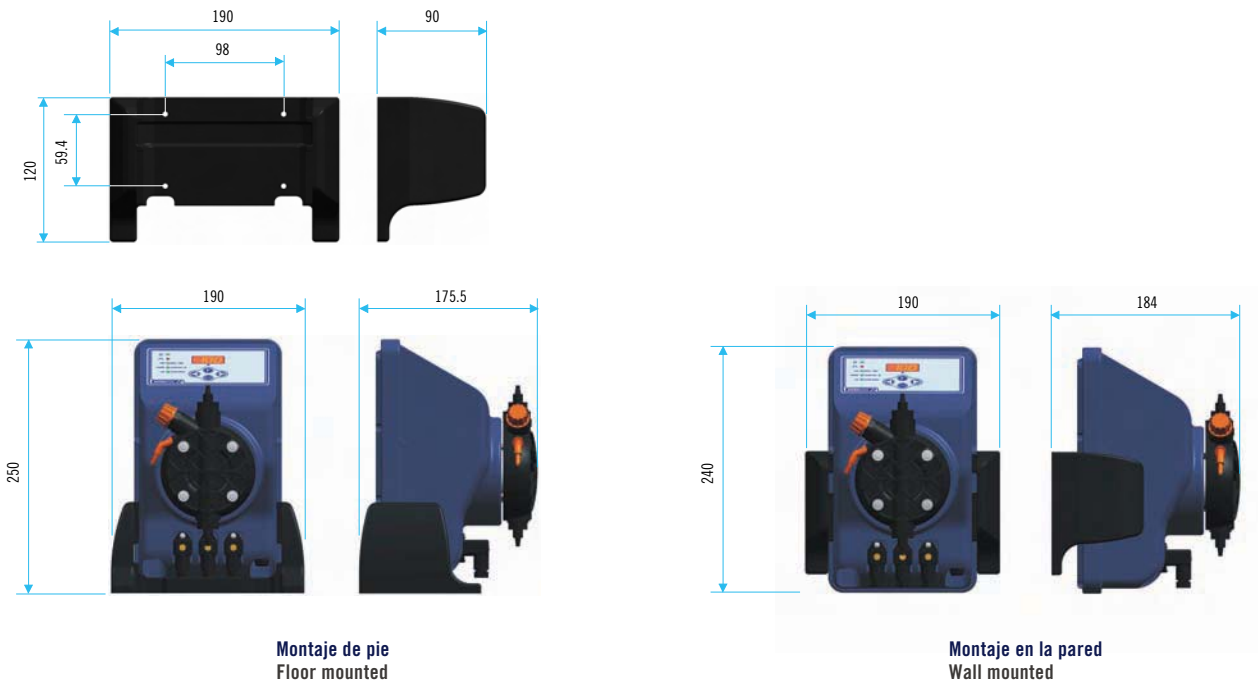
Montaje de pie Floor mounted